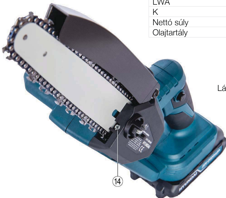
Láncfeszítő (14) felülnézetből